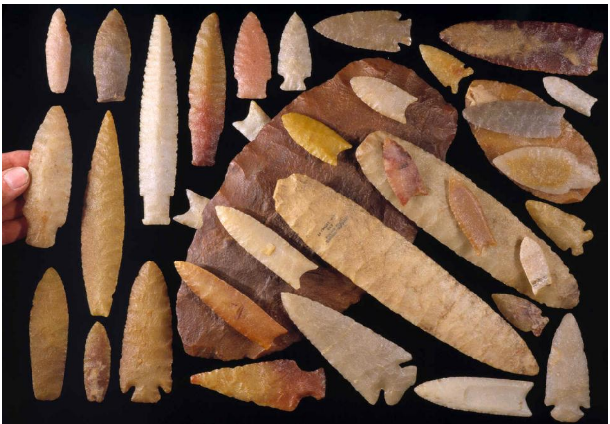
Культура Кловис. Северная Америка

Культура Кловис — доисторическая культура самого конца палеолита, распространенная на территории Северной и Центральной Америки. Культура Кловис была кратковременной – появилась 13 200 лет назад, закончилась 12 800 лет назад. Характеризуется весьма качественными орудиями труда и охоты.