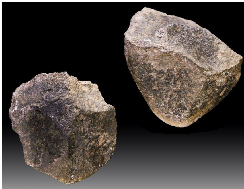
Олдувайские орудия. Африка

Олдувайская культура (галечная культура) — наиболее примитивная культура обработки камня, когда для получения острого края камень раскалывался обычно просто пополам, без дополнительной доработки. Возникла около 2,5 млн лет назад, исчезла около 1 млн лет назад.