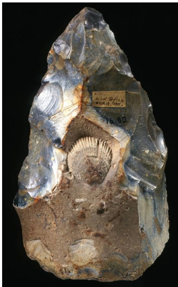
Поздне-Ашельское орудие с окаменевшей раковиной, изготовленное гейдельбергским человеком более 500 000 лет назад. Англия