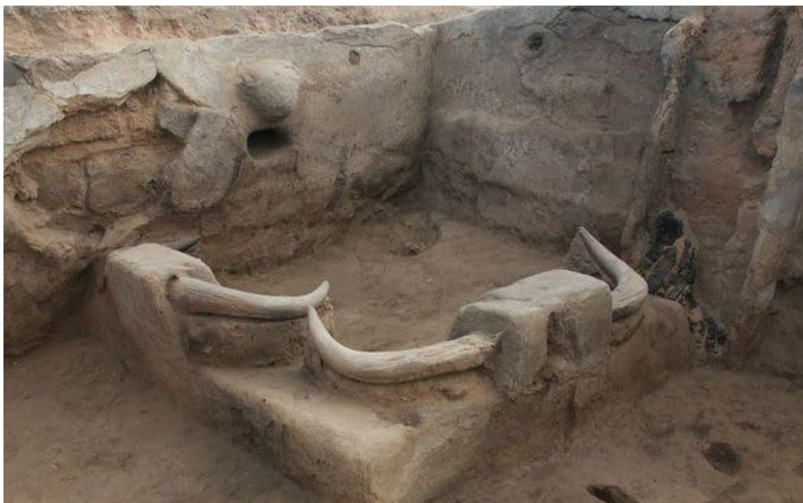
Чатал-Хююк был основан в 7200 г до н. э., имел до 10 000 жителей