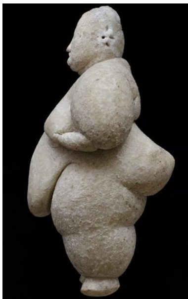
Скульптура из Чатал-Хююка. Около 7-го тыс. до н.э.

Так как в слоях Хиама еще нет зерен злаков с признаками одомашнивания, то можно сделать вывод, что идеологические изменения происходят раньше экономических перемен. Об это же свидетельствует и древнейшие постройки (храм) религиозного назначения в Юго-Восточной Турции – Гёбекли Тепе. Возраст древнейших построек комплекса оценивается в 12 000 лет (10-е тыс. до н.э.). При этом земледелие зародилось в этом районе на 500 лет позже.