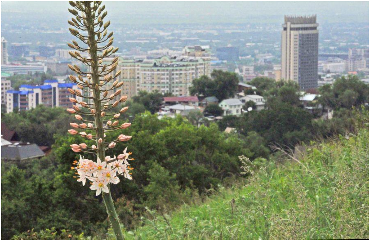
В Заилийском Алатау самые низкорастущие экземпляры (1050м) начинают цвести в конце мая