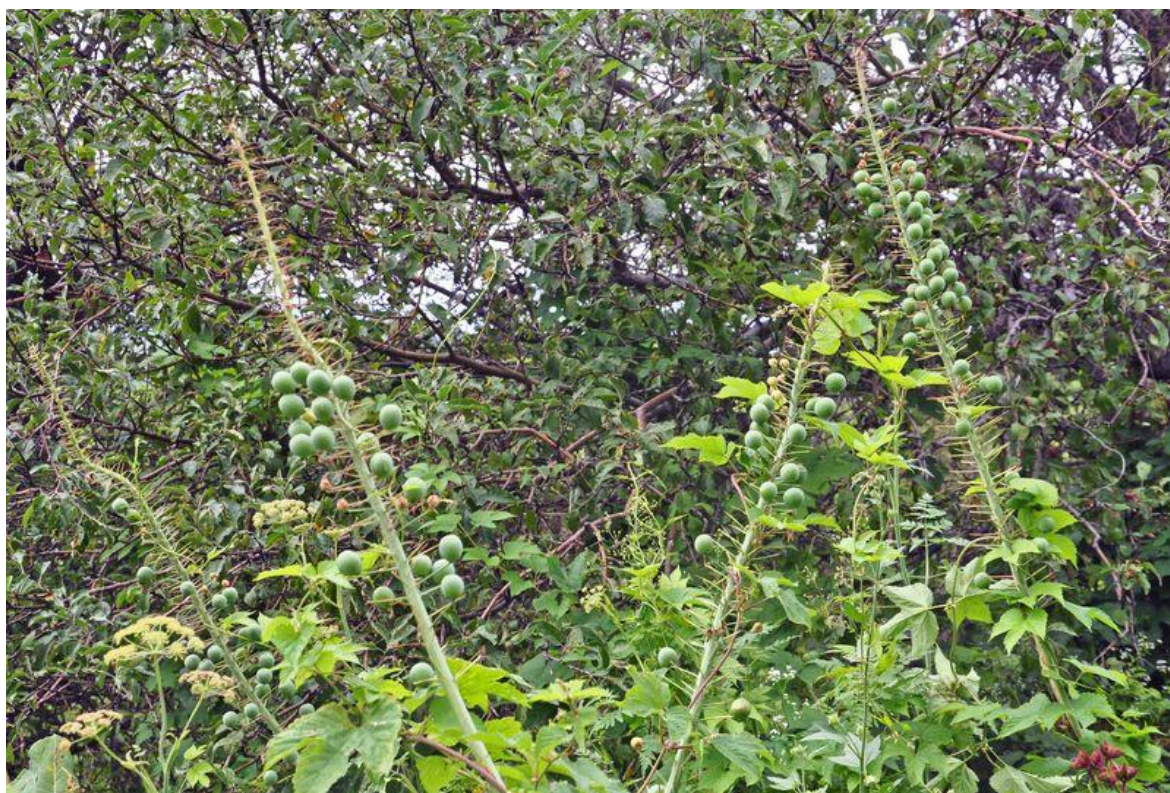
Шарики с семенами. Обычно осеменяется около 10% цветков эремуруса мощного