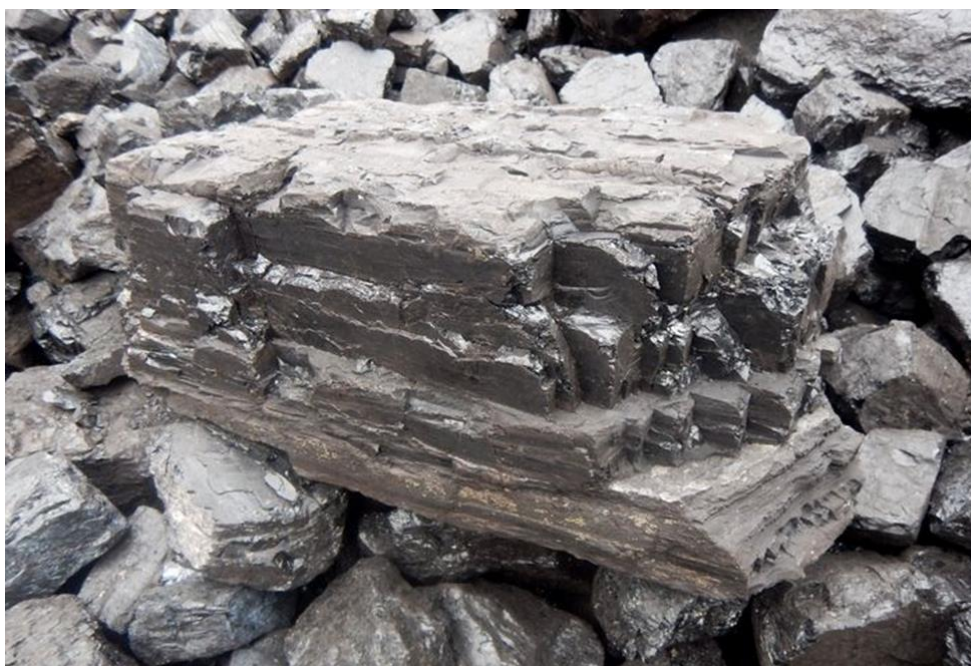
Каменный уголь.

Каменный уголь – плотная порода чёрного, иногда серо-чёрного цвета; содержит 75-90% углерода, 2,5-5,7% водорода, 1,5-15% кислорода. Каменные угли имеют более минерализованный состав органической массы в отличие от бурых, меньший выход летучих и обладают меньшей влагоемкостью. Теплота сгорания – 30,5-36,8 МДж/кг. Большая часть каменных углей относится к гумолитам; сапропелиты и гумитосапропелиты встречаются в виде линз и тонких прослоев.