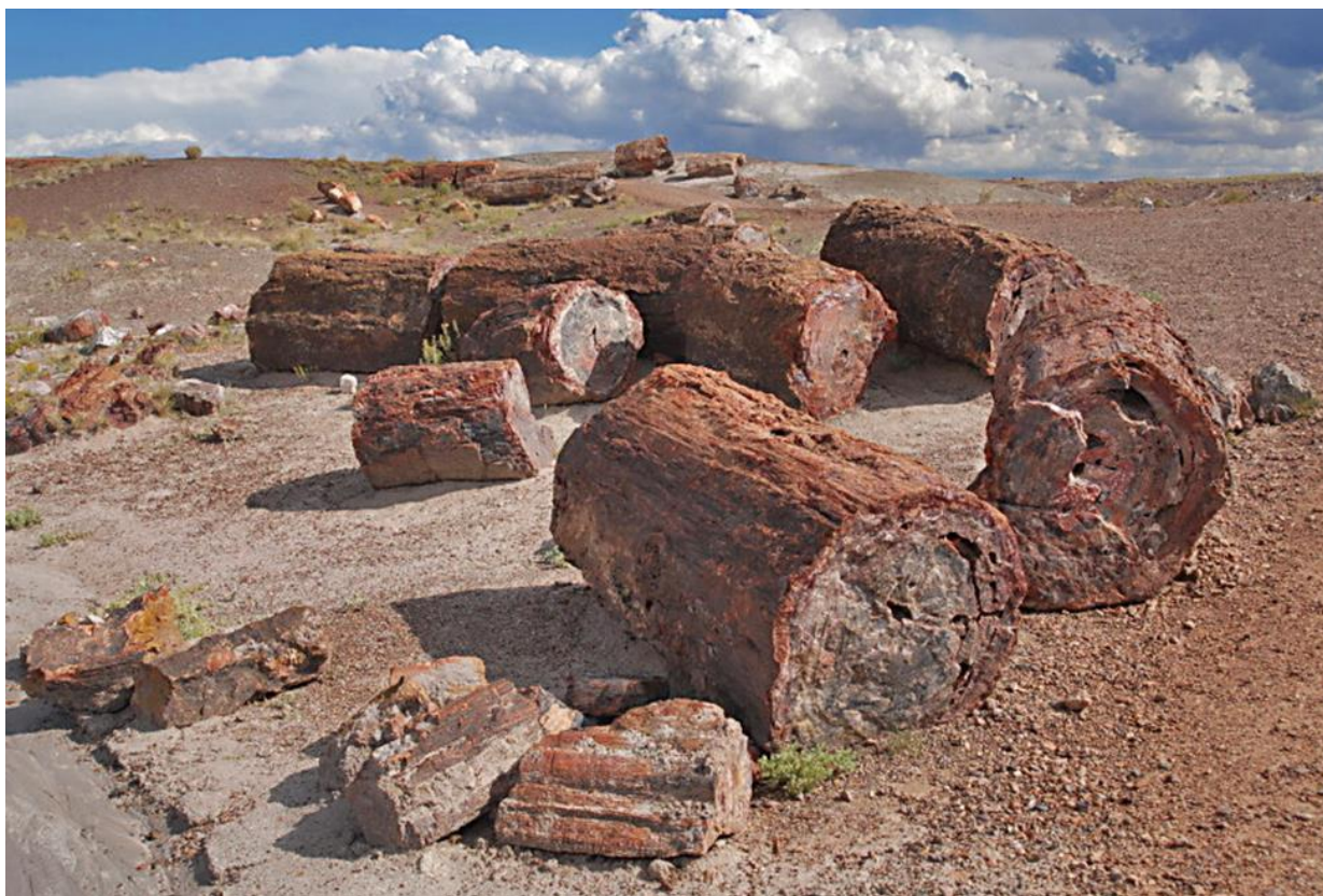
Петрифид форест. Forest mtritter.org

Самые значительные залежи окаменелого дерева: США – в Аризоне, в Южной Дакоте, в Айове, в штате Вашингтон, в штате Миссисипи, в штате Колорадо; аргентинская Патагония, Египет (окаменелый лес у дороги Каир - Суэц, территория у Нового Каира, Маади, оазис Эль Фарафра), Россия (Средняя Сибирь, Камчатка, Приморье, Чукотка), Бельгия (около Хугардена), Бразилия (геопарк Палеоротта), Греция (окаменелый лес на острове Лесбос), Индия (Тируваккарай около Мадраса), Канада (остров Акселя Хайберга в Нунавуте на севере страны), пески Ливии, Новая Зеландия (залив Карью на Кэтлинском побережье), Украина (Донецкая область), Мадагаскар.