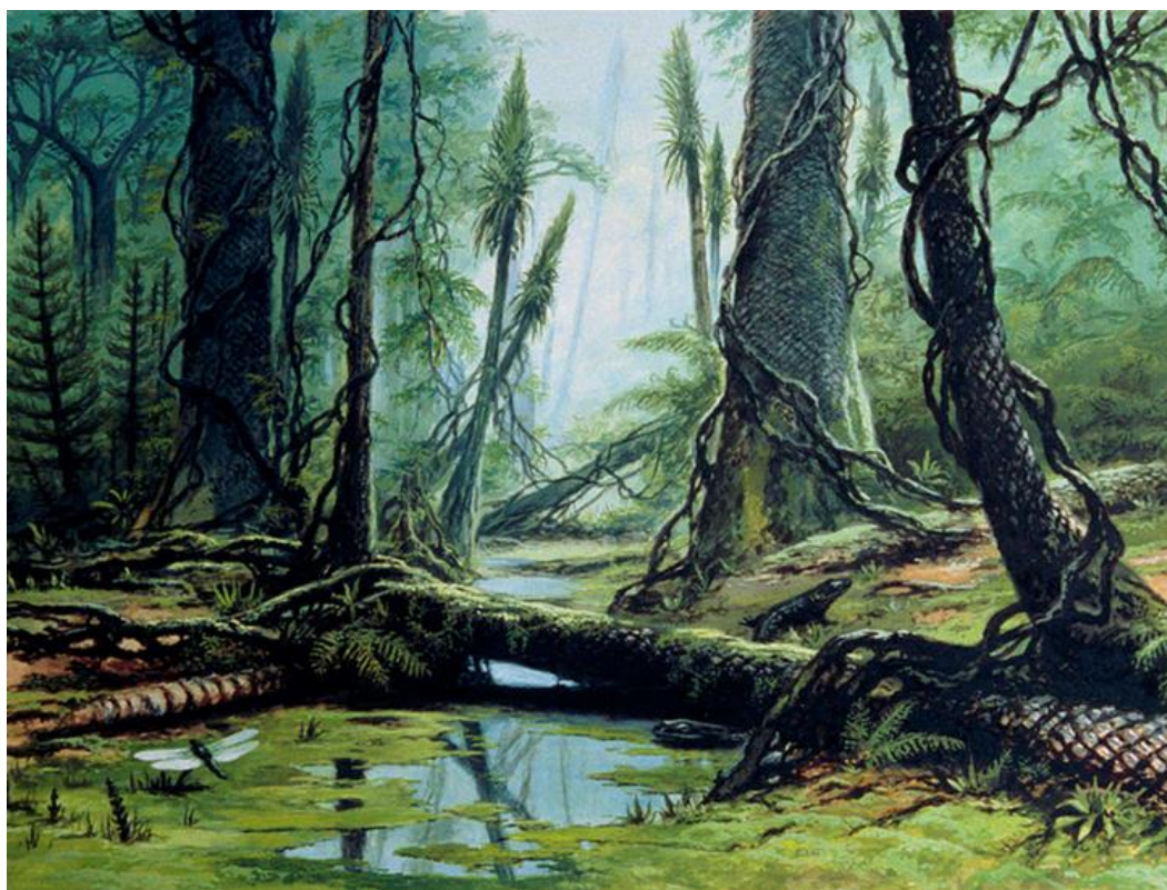
Лепидодендроновый лес каменноугольного периода. Ludek Pesek

Похолодание в середине периода повлекло за собой распространение на севере и юге планеты голосеменных кордаитовых с формированием кордаитовой тайги. Кордаиты были хвойными деревьями высотой до 30 метров с толщиной ствола до 1,5 метров. В своей верхней части они ветвились раскидистой кроной крупных ветвей. Кора кордаитов, как и у всех древовидных карбона, выполняла функцию фотосинтеза и опадала в течение всей жизни дерева. Кордаиты имели четкие годовые кольца, что свидетельствует о сезонности климата.