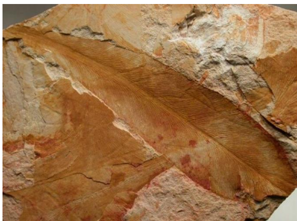
Отпечатки листьев Glossopteris browniana . Пермский период

Позднепалеозойские деревья были значительно менее устойчивы к сильным ветрам и эрозионной деятельности воды, чем современные. Палеозойские ураганы могли с легкостью положить весь лес на большой площади, но видимо скорость роста древовидной растительности в те времена превышала современную, и вскоре из молодой поросли снова вырастала лесная чащоба. Паводки и селевые потоки также часто сносили деревья и погребали их под грунтом. Прижизненное захоронение не разложившейся, то есть не окисленной древесины способствовало углеобразованию.