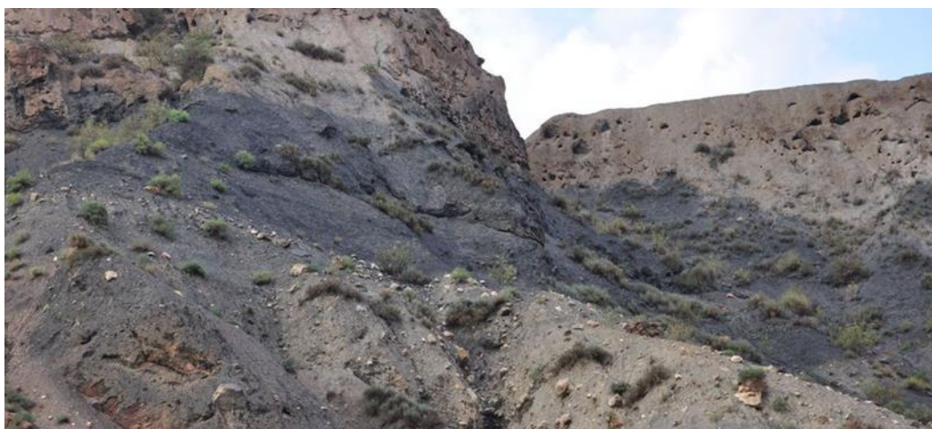
Угольный пласт. Таджикистан.

Обычная мощность отдельных пластов – от нескольких сантиметров до нескольких метров. Рекордные мощности сплошных пластов достигают сотен метров.