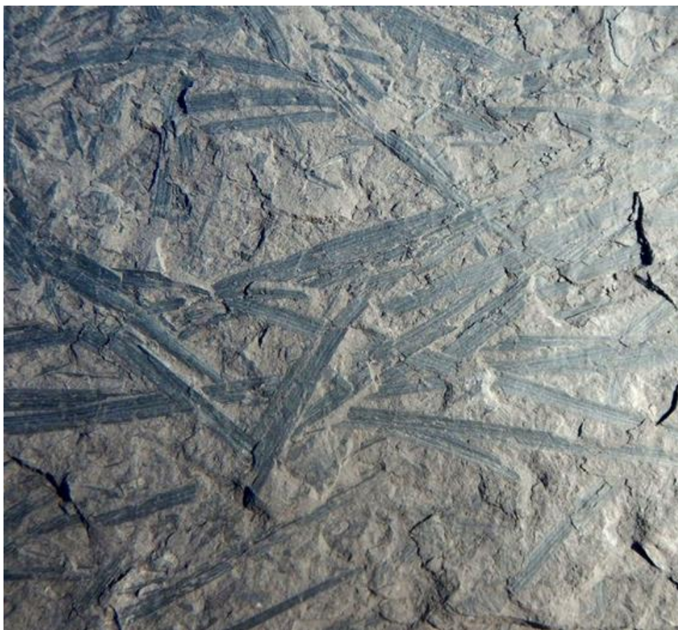
Отпечатки в юрском угле. Центральный Казахстан.

В меловом периоде основными углеобразователями являлись саговниковые, беннеттитовые (близкие родственники саговниковых), древовидные папоротники, хвойные. Сформированные в первой половине мела цветковые (покрытосеменные) быстро заняли господствующее положение во второй половине периода. Древовидные формы цветковых достигли невиданных ранее размеров – высота деревьев превышала 100м, а толщина стволов достигала 15м.